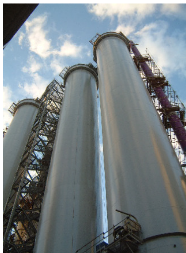
Estrutura do revestimento da Tecnolita