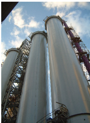
Torres: 70 m de altura e 7,2 m de diâmetro cada uma

Empresa protegeu as três maiores torres de branqueamento de celulose já construídas